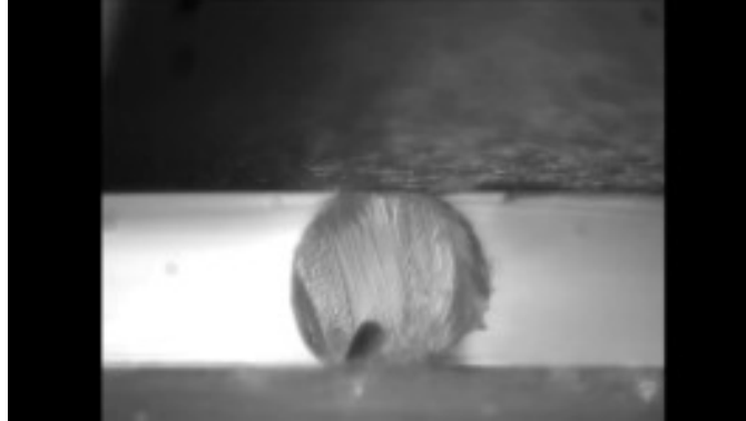
Figure 2 : Exemple d'image de section transverse d'une fibre de PA11 utilisée pour la détermination du module transverse par corrélation d'image intégrée.

une vitesse de déplacement constante, suivi d'un plateau au palier de déplacement et d'une décharge monotone. Le module d'élasticité transverse est alors déterminé à partir des données expérimentales (images de la section droite, voir Fig 2, et de la force) enregistrées lors de la décharge, du modèle analytique développé et des valeurs du module longitudinal et du coefficient de Poisson déterminés préalablement grâce à un essai de traction sur fibre élémentaire.